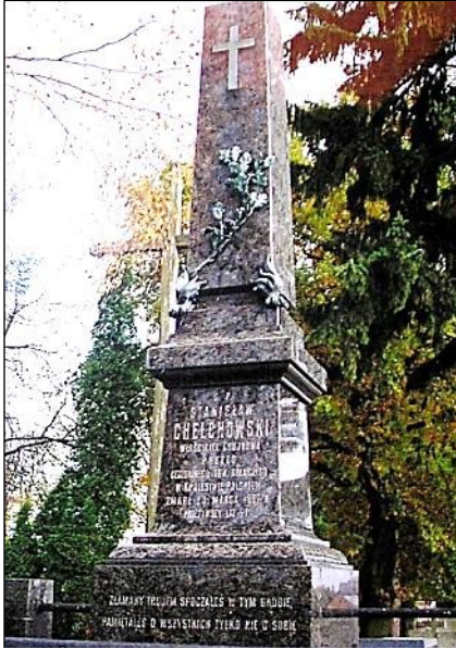
Grób Stanisława Chełchowskiego w Czernicach Borowych